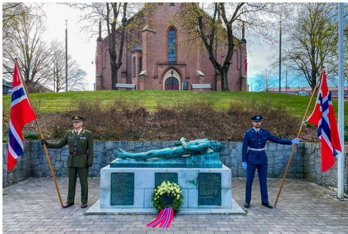
v/De falnes monument (fra v. T. Surdal, B. T. Karstensen)

Frigjøringsdagen 8. mai måtte også i 2021 gjennomføres uten noe publikum til stede, men kranse- nedleggelsen ble filmet og sammen med opptak av taler og musikkinnslag sendt på SA-tv, kommunens nettside og facebook.